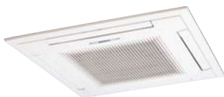
AUG25U, AUG30U, AUG36U, AUG45U, AUG54U